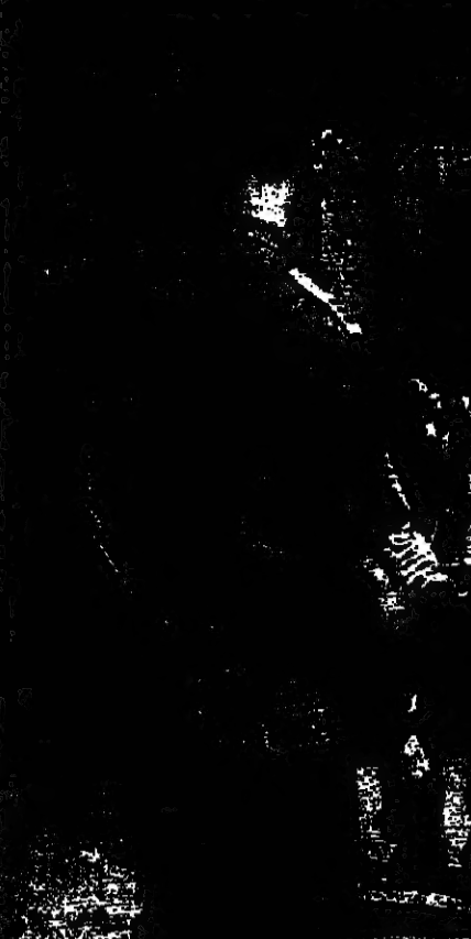
جندي اسرائيلي يمدح فلسطينيا من سقوط مدينة القدس

وانتقدت اسرائيل مسحاكات للسلام بعد الهجوم المتكرر وهدت من الضميين بان تخطى من جديد للناطق التي سلمها الاسرائيليين لاعتقال «ارهابيين» اذا لم تكم السلطة الفلسطينية بهذه المهمة. وطالب مجلس الوزراء الاسرائيلي عرفات بان يحمي على الفلسطينيين الاسرائيليين من الهجوم المتكرر الذي يهدد لحياتهم في سوق محلي يهودا بالقدس للزيج الذي قتل فيه 13 شخصا واصيب 170 آخرون.